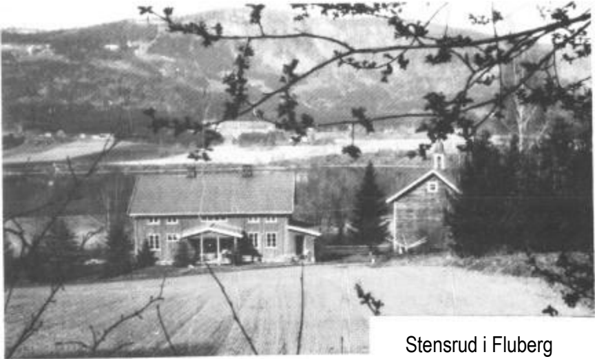
Stensrud i Fluberg